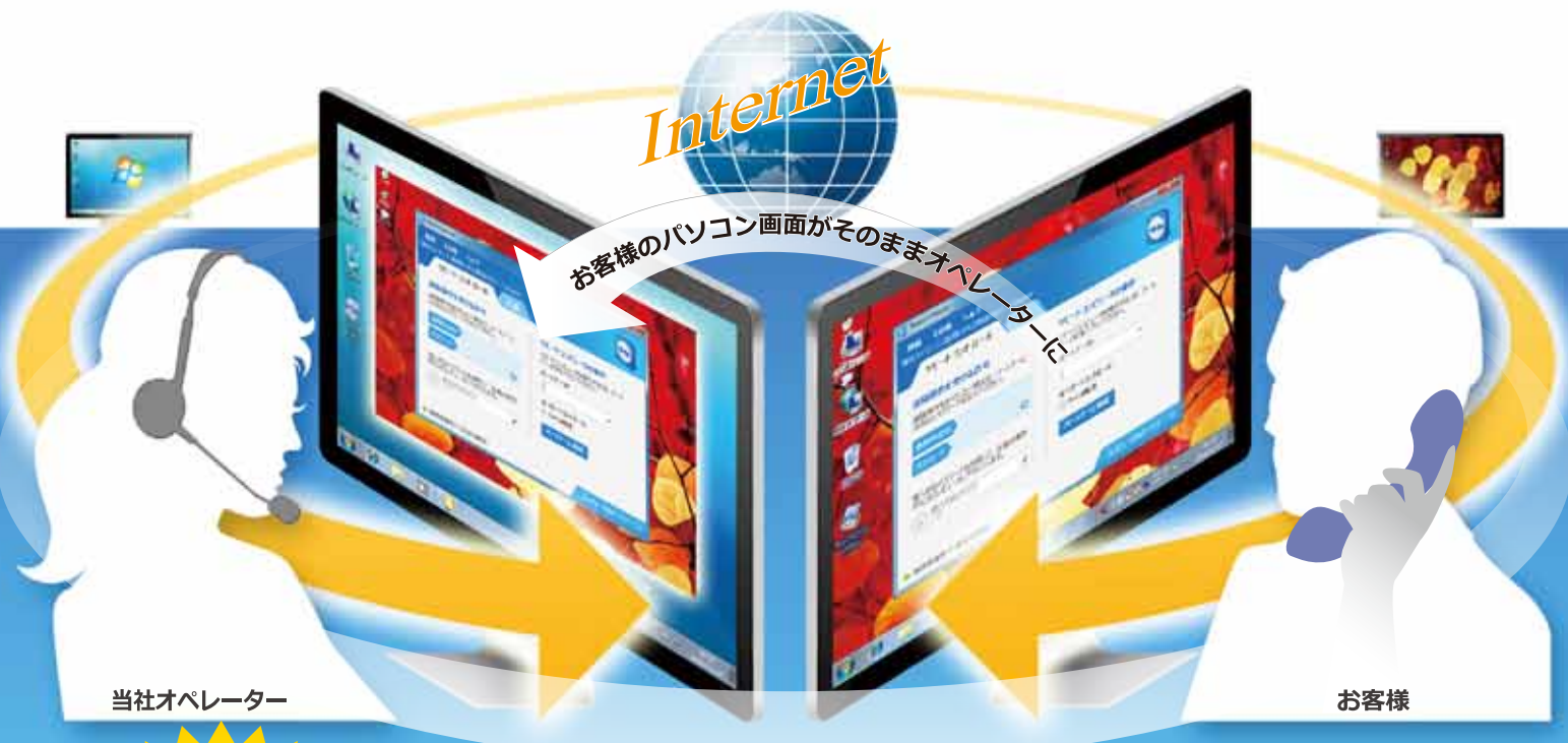
当社オペレーター